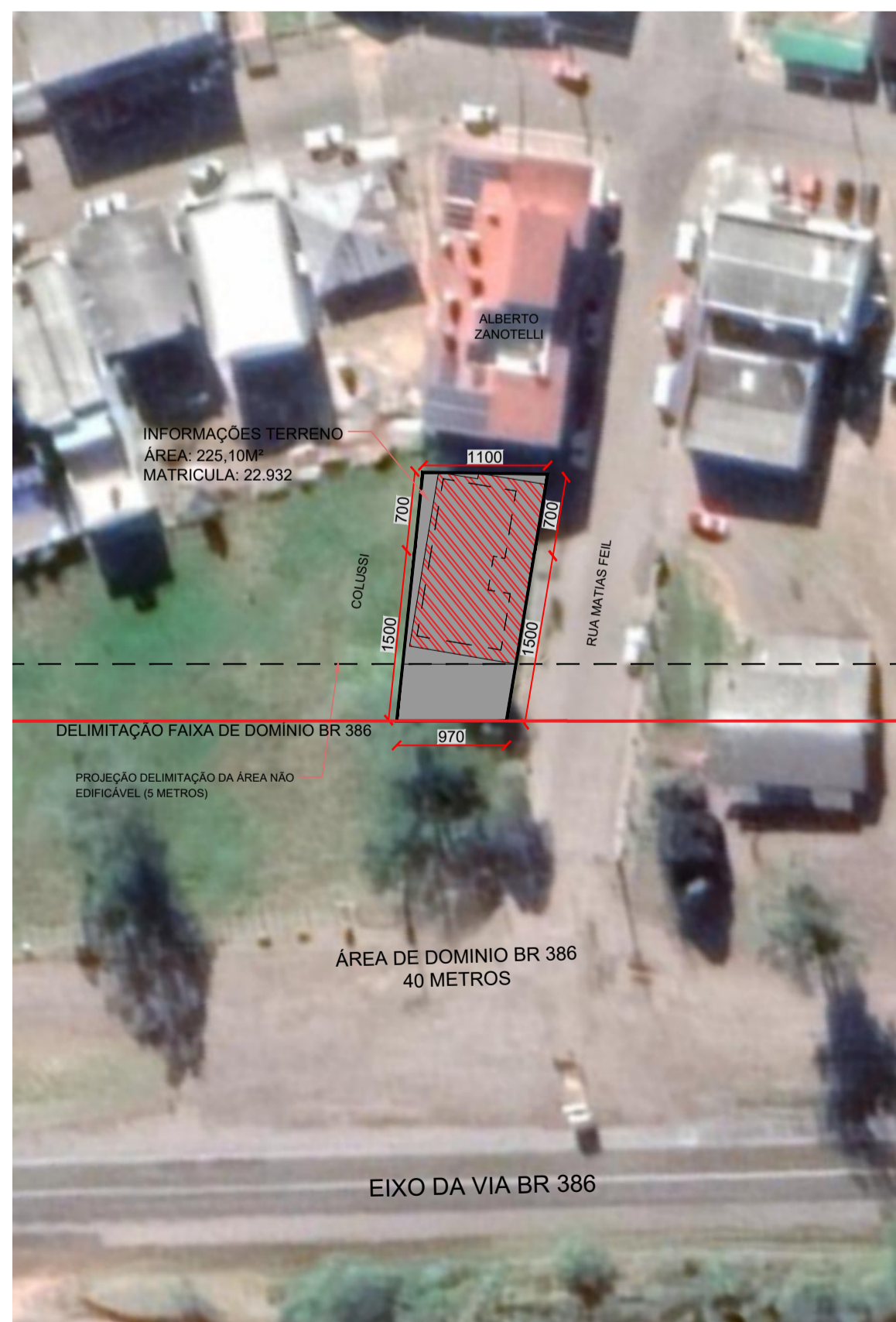
4 PLANTA DE LOCALIZAÇÃO CCPAT 03 Escala: 1/500