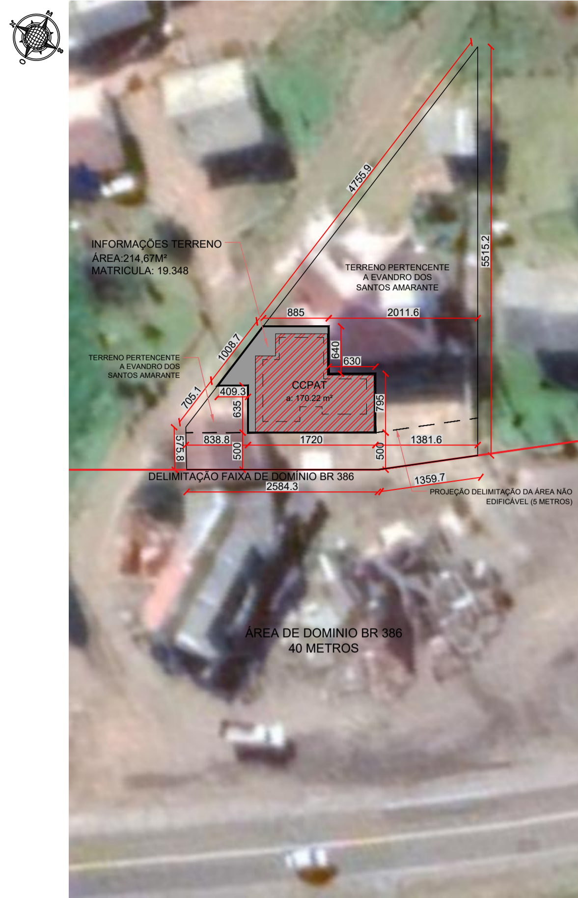
2 PLANTA DE LOCALIZAÇÃO CCPAT 01 Escala: 1/500