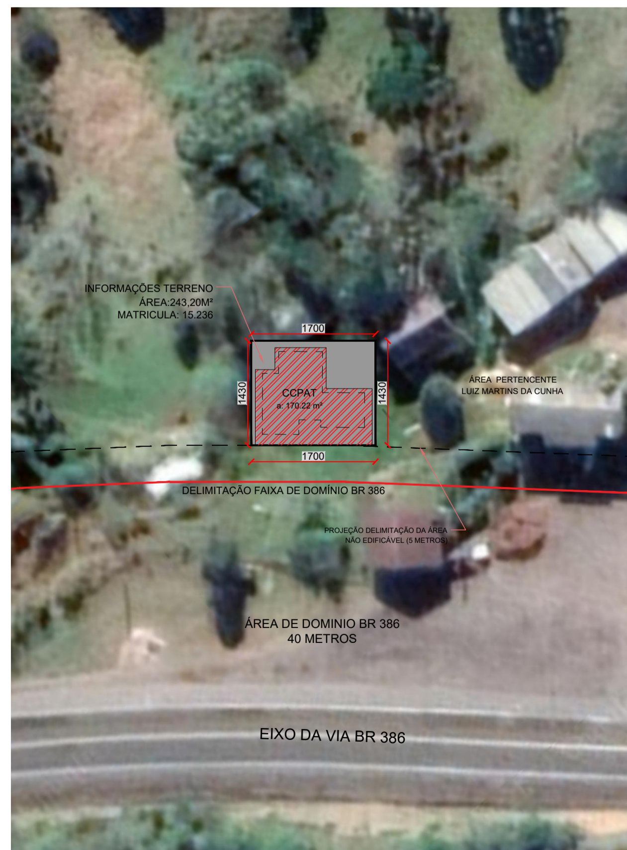
5 PLANTA DE LOCALIZAÇÃO CCPAT 04 Escala: 1/500