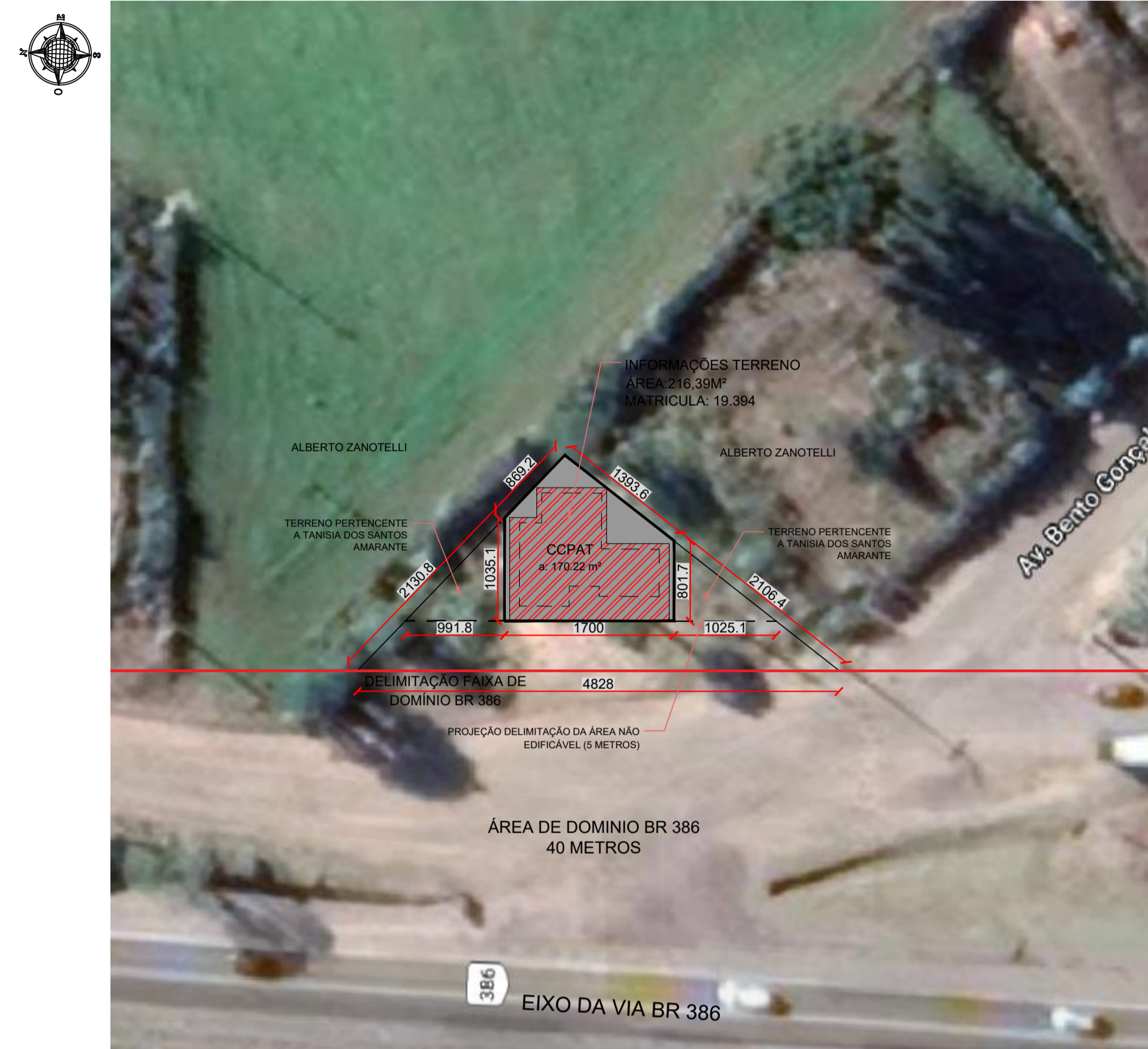
3 PLANTA DE LOCALIZAÇÃO CCPAT 02 Escala: 1/500